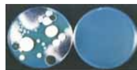
一般細菌・真菌・抗菌試験